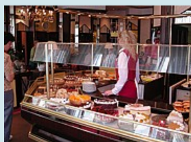
Adresse für Schleckermäuler