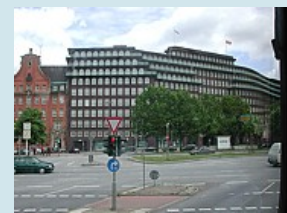
Hamburg, das Chile-Haus