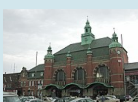
Bahnhof von Lübeck