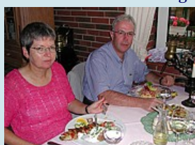
Hotel Landkrug in Kappeln - Fisch in allen Variationen