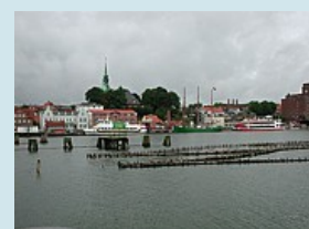
Blick auf Kappeln an der Schlei

Eckernförde - Kiel Fahrt durch den "dänischen Wohld" über Strände, Schilksee nach Holtenau. Hier überqueren wir den Nord-Ostsee-Kanal. Weiter zur Landeshauptstadt Kiel.