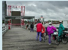
Aufbruch: Kiel Richtung Hohwacht - Lütjenburg