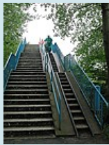
Querung vor Laboe