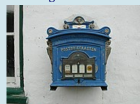
Briefkasten Schloss Glücksburg

Kappeln - Eckernförde Vorbei am Schwansersee, durch das Ostseebad Damp und entlang riesiger Campingplätze erreichen wir das beschauliche Ostseebad Eckernförde. Zum anschauen: schön angelegter Kurpark, Getreidesilo von Hans Hansen. Übernachten im Hotel Seelust.