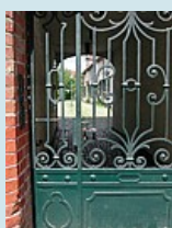
Wohnstift an der Glockengiesserstrasse