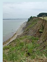
Steilküste vor Travemünde