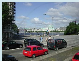
Hamburg an der Binnenalster