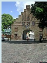
Flensburg das Nordertor