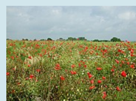
Unterwegs Richtung Kiel