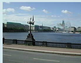
Hamburg an der Binnenalster