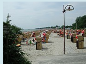
Strandkörbe bei Grömitz