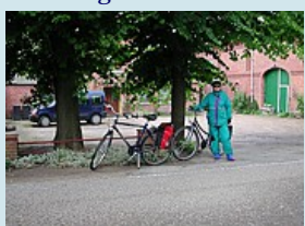
warten im Regen...