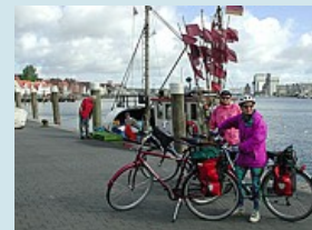
Flensburg Start zur Tour

Flensburg - Kappeln leider ändert sich das Wetter schnell und Regen ist angesagt. Zum Glück sind die Hotels alle geheizt, wer weiss wie wir sonst unsere nassen Sachen bis zum nächsten Morgen getrocknet hätten. Übernachten im Hotel zum Landkrug in Kappeln an der Schlei. Das Essen ist deftig und lecker... Wir geniessen Fisch in allen Variationen. Ein Rundgang durch die Stadt lohnt sich - der Landarzt lässt grüssen.