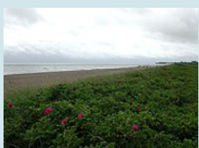
entlang der Küste nach Eckernförde

Eckernförde - Kiel Fahrt durch den "dänischen Wohld" über Strände, Schilksee nach Holtenau. Hier überqueren wir den Nord-Ostsee-Kanal. Weiter zur Landeshauptstadt Kiel.