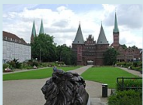
Lübecks Wahrzeichen - das Holsten Tor