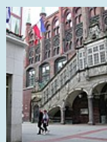
Treppe zum Lübecker Rathaus