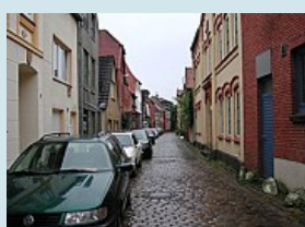
Eckernfördes - beschauliche Gassen