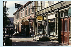
Altstadt von Trondheim