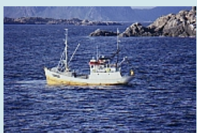
Fischerboot vor den Lofoten