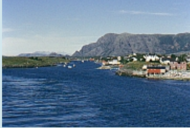
kräftige Farben prägen das Landschaftsbild...