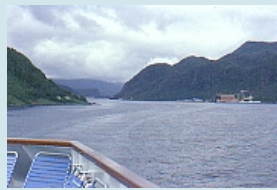
Ausfahrt von Bergen durch den Fjord