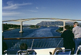
und kühne Bauwerke überspannen die Gewässer