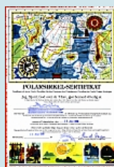
Zertifikat - Polarkreis