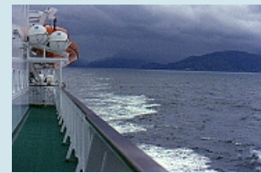
...ins offene Meer