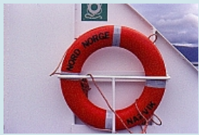
Retteringsring der MS Nordnorge

Natur, Eindrücke, Begegnungen mit Menschen lassen sich nur schwer beschreiben. Täglich ändern sich Küste und Landschaft. Üppige Vegetation und karge Landschaften, kleine Fischerorte und grosse Städte, offene See und enge Passagen