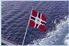
stolz weht die Postflagge