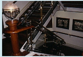
das Treppenhaus der MS Nordnorge