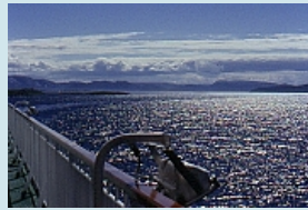
Abendstimmung auf See