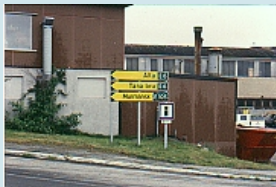
Wegweiser nach Russland - Kirkenes

Im Liegestuhl an Deck mit einem Buch oder nur die Landschaft genießen, relaxen an einer der gepflegten Bars, oder eine Wanderung rund ums Schiff, jeder kommt auf seine Rechnung.