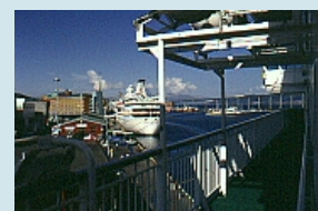
Im Hafen von Tromsø