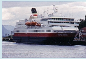
Die Nordnorge im Hafen von Molde