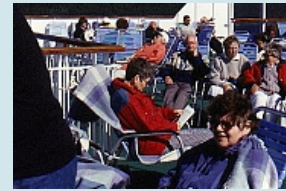
relaxen an Bord