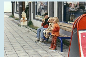
Eiszeit in Kirkenes