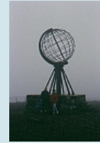
Nordkap - Wahrzeichen