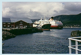
im Hafen von Stokmarkenes