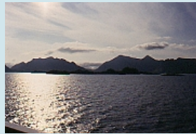
Abendstimmung über den Lofoten