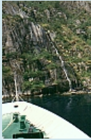
Wendemanöver im Trollfjord