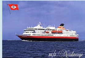
unser schwimmendes Hotel...