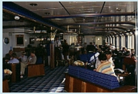
eines der Decks