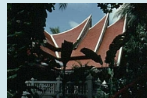
Hotel Marina Cottage auf Phuket