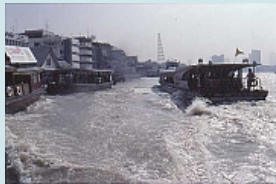
auf dem pulsierenden Chao Phraya