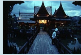
Hotel Pearl Village auf Phuket