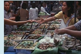
riesige Auswahl an leckeren Dingen