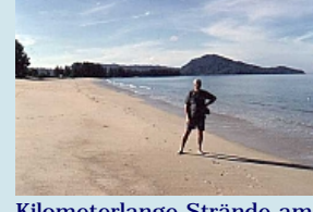
Kilometerlange Strände am Nai Yang Beach