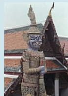
Tempelwächter beim Wat Phra Kaeo