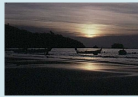
Sonnenuntergang Nai Yang