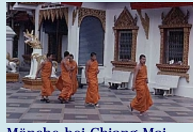
Mönche bei Chiang Mai