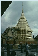
Lamphun Wat Phrathat Haripunchai

Von der nördlichsten Stadt Thailands an der Grenze zu Myanmar (Burma) weiter nach Chiang Mai, der Rose des Nordens. Von hier fährt uns der Nachtzug zurück nach Bangkok.