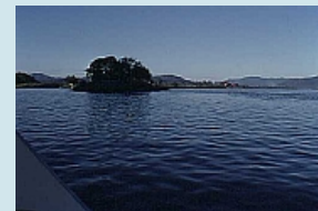
Das goldene Dreieck vom Boot aus gesehen