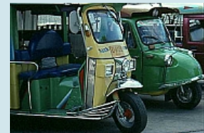
Tuk Tuk in Ayutthaya