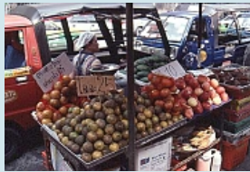
eintauchen in die Farben eines Marktstandes