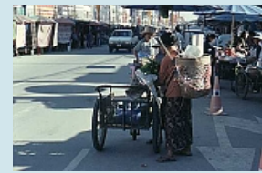
Mae Sai Markt