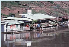
Ayutthaya Leben am Fluss