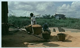
und beim weiterverarbeiten