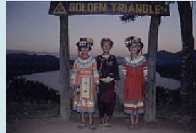
Posieren am goldenen Dreieck