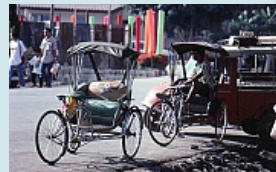
... warten auf Kundschaft