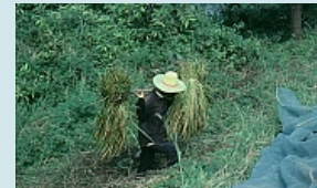
Reisbauer beim ernten...