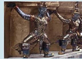
weitere reich verzierte Figuren beim Wat Phra Kaeo