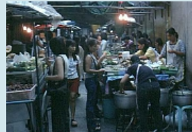
Garküchen auf dem Nachtmarkt in Patpong