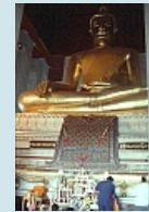
Ayutthaya Wat Mongkol Boree

... und weiter geht es nun auf die Reise in den Norden