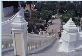
Saraburi Phra Buddha Tempel

Beeindruckend die Weite der Reisfelder und dann nach einer Fahrt durch Hügel, der Blick auf den gemächlich dahinfließenden Mekong, da wo sich die Grenzen von Burma, Laos und Thailand treffen, das Goldene Dreieck, "berühmt" vor allem durch den Drogenschmuggel. Der Mekong, Transportweg für Güter und Umschlagplatz für die angrenzenden Länder.