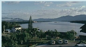
Blick über den Mekong hinüber nach Laos und ganz links nach Burma (Myanmar)

harte Arbeit bei sengender Hitze in den Feldern, nass bis zu den Hüften, der Alltag der Bauern und dafür der im Verhältnis reich gedeckte Tisch.