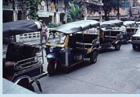
Tuk Tuk - im Strassenbild Bangkoks nicht wegzudenken

und Eindrücke erfreuen das Auge des Reisenden ... von den Details der liebevoll verzierten Tuk Tuk's zu den gigantischen Buddha Figuren und eindrucklichen Tempelanlagen über die harte Arbeit der Bauern in den Reisfeldern prägen sich täglich neue Eindrücke ein.