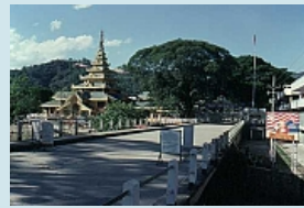
Mae Sai und die Grenzbrücke zu Burma