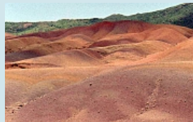
farbige Erde - das Wunder von Chamarel