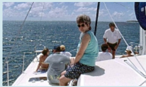
mit dem Katamaran durch die Lagune