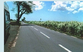
endlose Zuckerrohrfelder säumen die Strassen