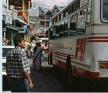
Grand Baie - Hauptstrasse