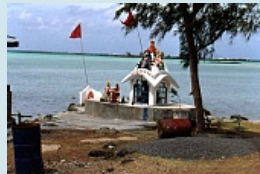
Gebetstempel der Hindus und