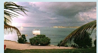
Abendstimmung beim Hotel Marina Resort in Grand Baie