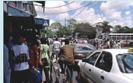
Centre de Flacq