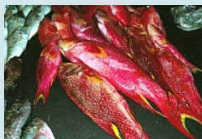
und Fische und Meeresgetier...

Ein Ausflug in den botanischen Garten von Pamplemousses, 1767 von Pierre Poivre - im Garten des französischen Gouverneurs erschaffen -, sowie in den Casela Vogelpark, kombiniert mit einem Besuch in der Hauptstadt Port Louis ist empfehlenswert.