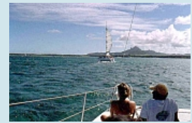
geniessen ist angesagt...