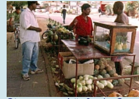
Strassenverkäufer in Grand Baie