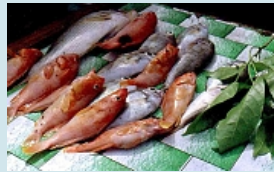
...frisch vom Fang