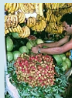
...eine Fülle von Früchten