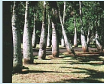
Botanischer Garten von Pamplemousses