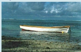
Stimmung beim Hotel Ambre