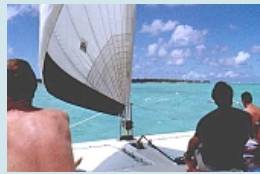
Wind, Sonne und Kurs auf die Ile aux Cerfs