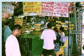
Farben und Gerüche prägen den Markt von Port Louis

Farbenprchtige Märkte wie in der Hauptstadt Port Louis oder auf dem Lande in Centre de Flacq findet man fast überall.