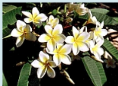
eine Fülle von Blumen im Botanischen Garten

als Abschluss einer unvergesslichen Reise