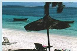
Badestrand Hotel Ambre in Belle Mare