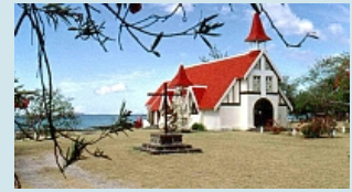
christliche Kirche bei Grand Baie